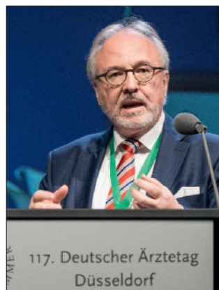
Rudolf Henke, Präsident der Ärztekammer Nordrhein: Die Verbesserung der Lebensqualität stellt eine urärztliche Aufgabe dar.

Auch das seit 2008 eingeführte Hautkrebs-Screening hat einen deutlich erkennbaren Nutzen in der früheren Diagnose und damit weniger invasiven Behandlung – bei geringen Risiken. Als großer Erfolg muss auch die im Rahmen der Darmkrebs-Früh-